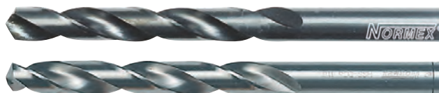
For stainless steel